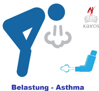
Belastung - Asthma